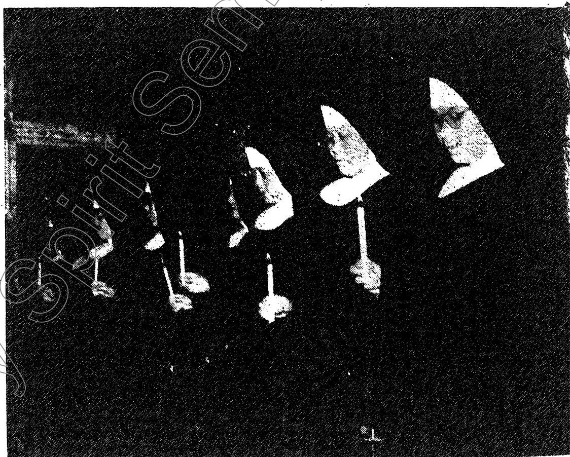
封面：北京西什庫總堂在 1956 年聖誕夜舉行子時大彌撒。主禮者為宗懷謨主教。