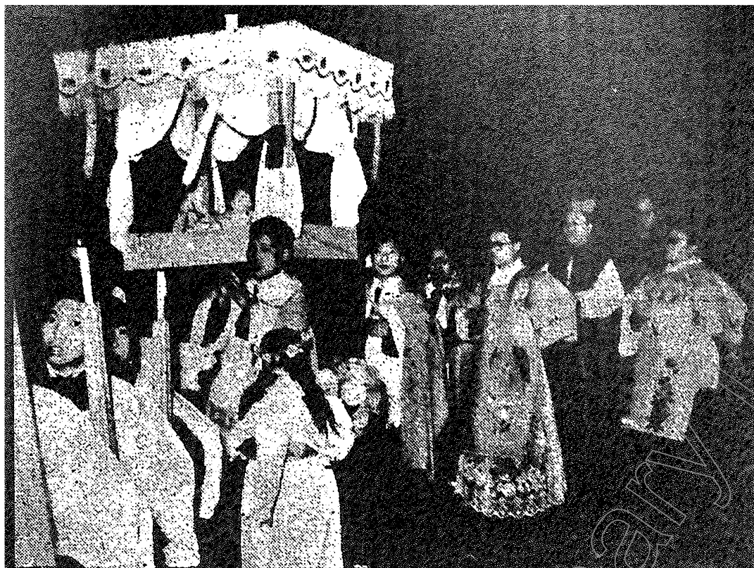
上]北京北堂子時彌撒前迎聖嬰。