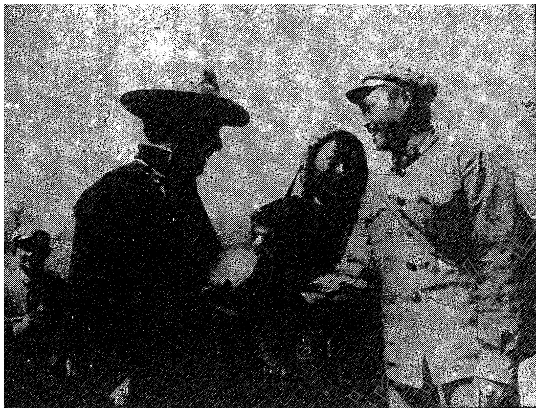
駐西藏的人民解放軍幫助藏胞耕作，在休息時，藏胞請解放軍戰士喝青稞酒。