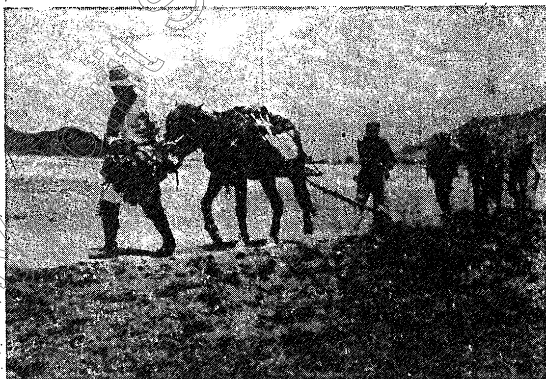
駐隆子宗的人民解放軍部隊抽出軍馬幫助羣眾搶耕搶種。 新華社記者 劉長忠 攝 (傳真照片)